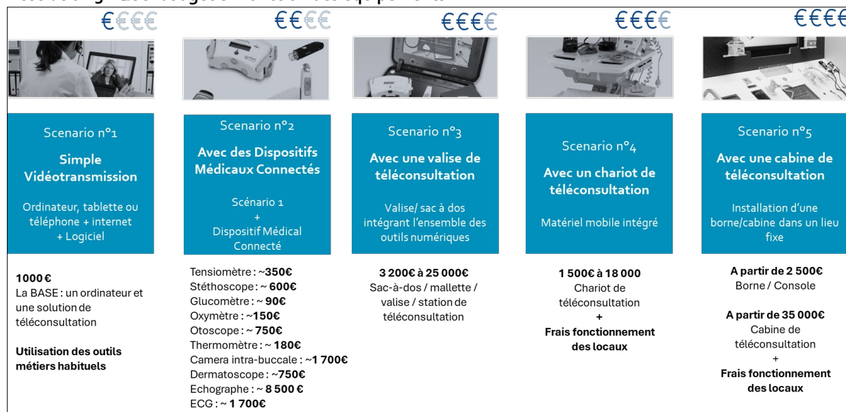
Illustration 3 - Quel budget en fonction des équipements ?