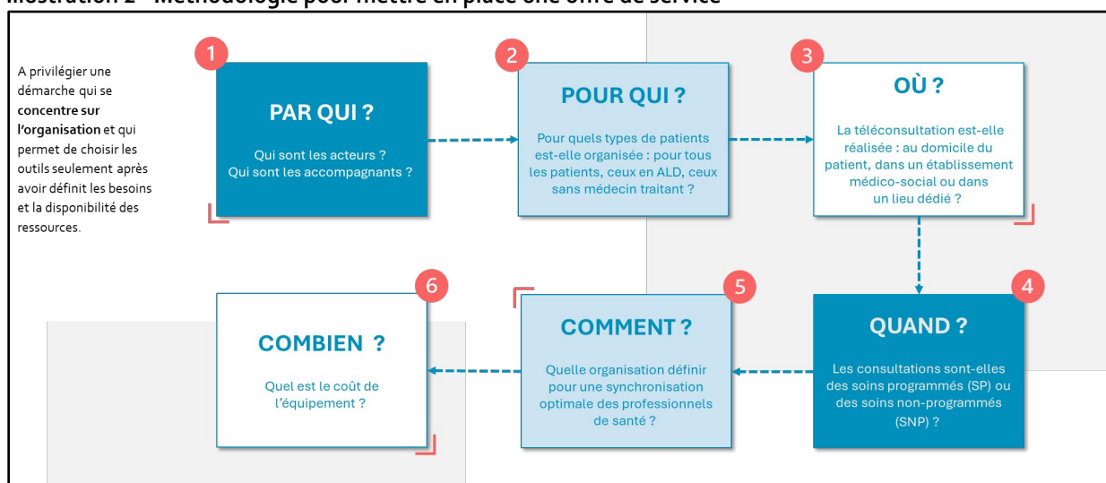
Illustration 2 - Méthodologie pour mettre en place une offre de service